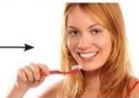
Догляд за порожниною рота