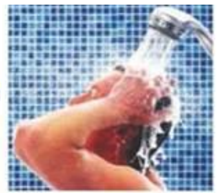
Догляд за шкірою