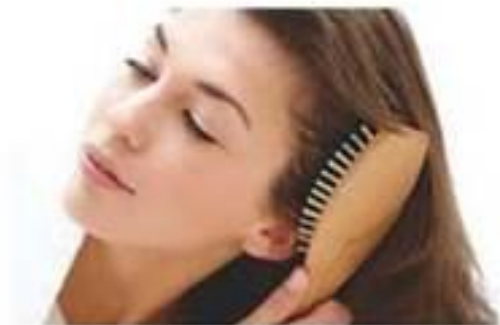
Догляд за волоссям